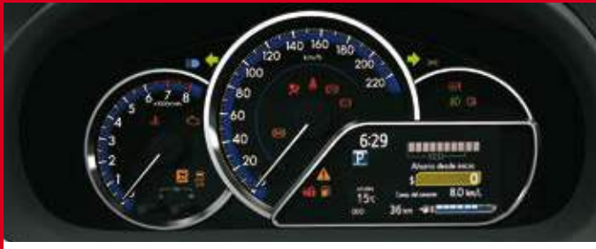
Display de información múltiple de 4,2". (1)