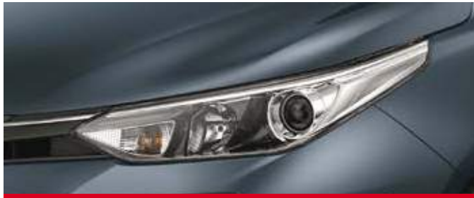
Ópticas delanteras halógenas con regulación en altura y proyector. (2)