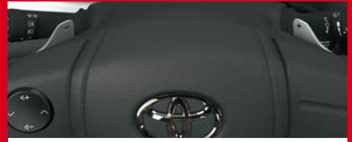
Paddle Shifts (levas en el volante). (2)