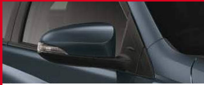
Espejos retráctiles eléctricamente. (1)