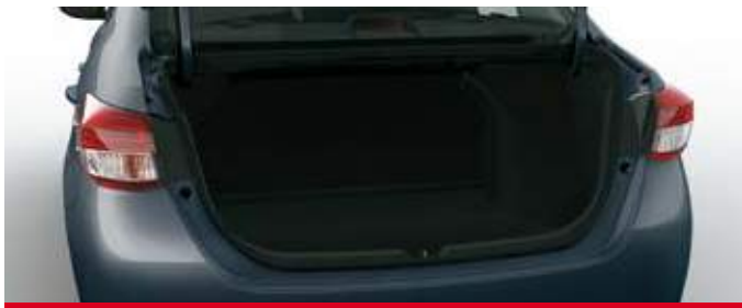
Apertura de baúl con comando a distancia. (1)