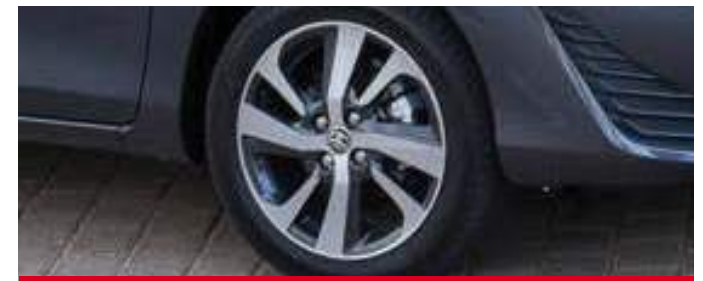
Llantas de aleación de 16". (3)