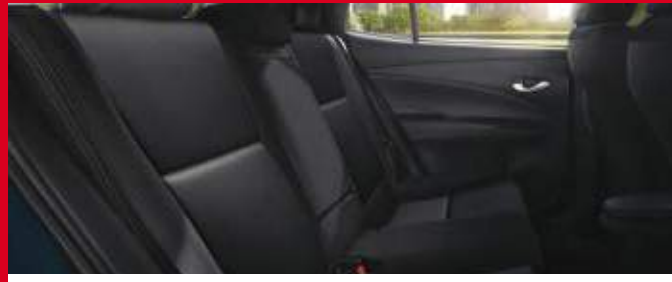
Asientos con tapizado de cuero natural y ecológico. (2)