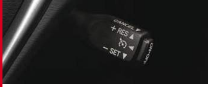
Control de velocidad crucero. (4)