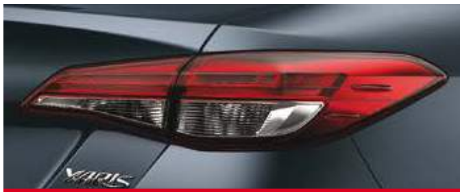
Faros traseros de LED. (2)