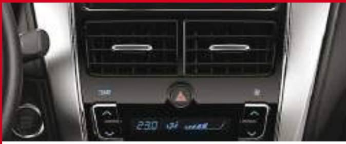
Aire acondicionado con climatizador automático digital. (1)