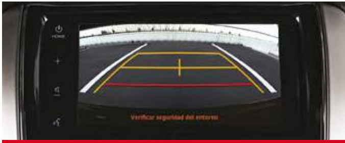
Cámara de estacionamiento. (2)