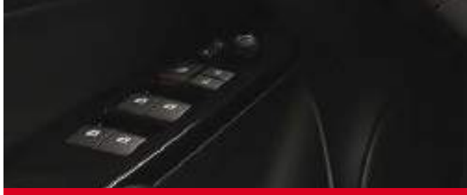
Levanta cristales eléctricos con función "One Touch" en las cuatro puertas. (2)