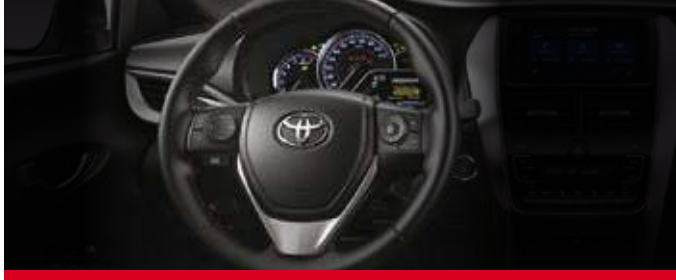
Volante multifunción. (1)