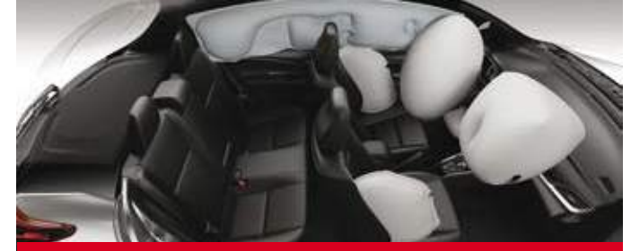
Airbags frontales (conductor y acompañante), laterales (x2), de cortina (x2) y de rodilla (para conductor). (1)