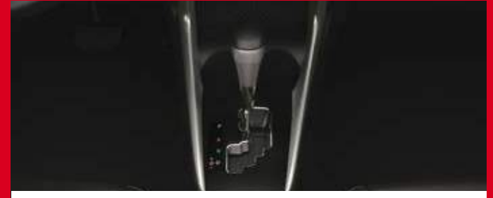
Caja automática CVT de 7 velocidades. (4)