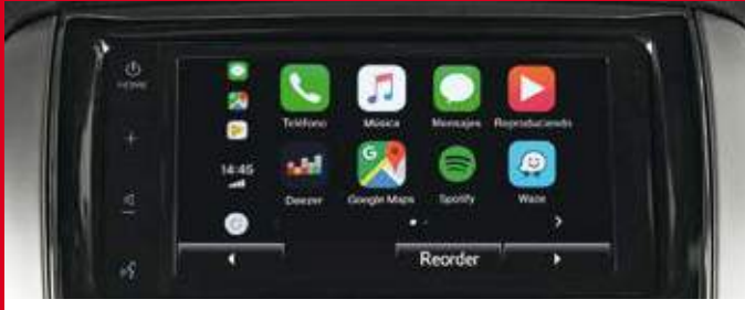
Audio con pantalla táctil LCD de 7" con conectividad: Apple CarPlay® & Android Auto®. (1)*