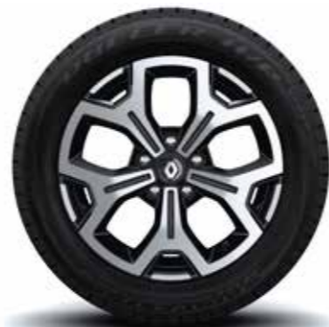
Llanta 17" diamantada Iconic 4x4