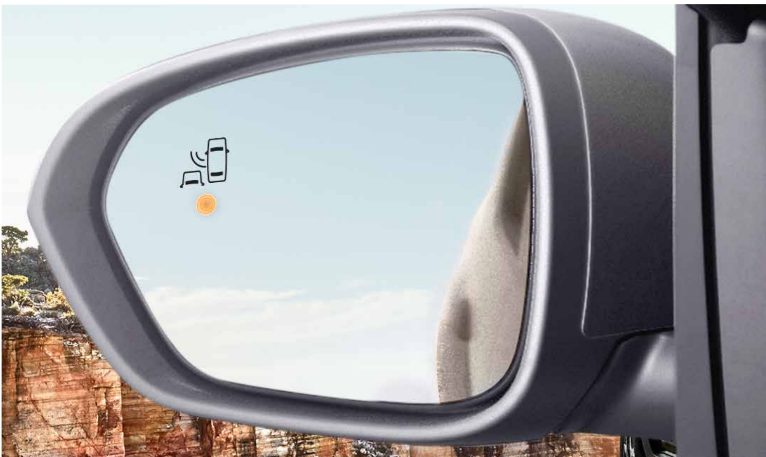
BSW - Sensor de punto ciego

El nuevo Renault Duster cuenta con un completo equipamiento tecnológico para mantener bajo control todas las variables de conducción y brindar la mayor seguridad a los pasajeros.