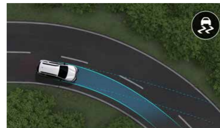
ESP - Control de estabilidad