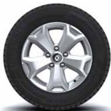
Llanta 16" aleación Intens y Outsider