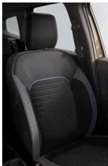
Intens, Outsider e Iconica 4x4