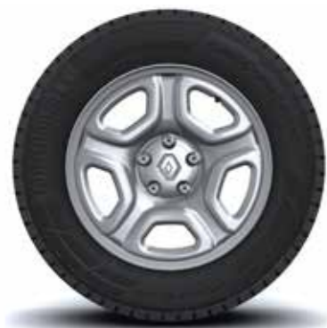
Llanta flex 16" acero Zen