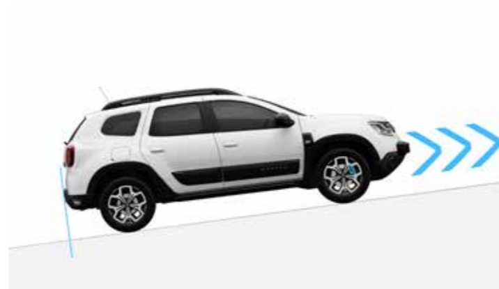
HSA - Asistencia al arranque en pendiente