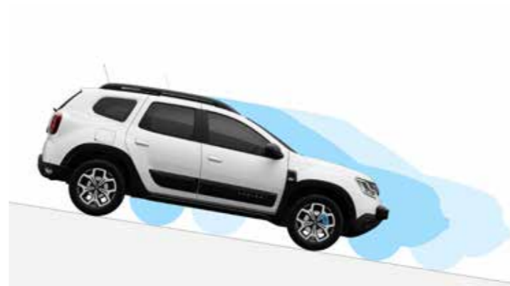
HDC - Asistencia al descenso en pendiente