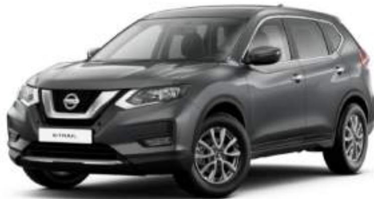
Gris Oscuro KAD

Consultar a su zonal sobre la disponibilidad de colores