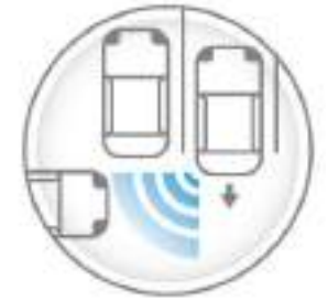
REAR CROSS TRAFFIC ALERT

Monitor inteligente de visión periférica 360°