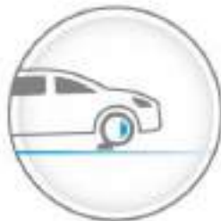
INTELLIGENT RIDE CONTROL