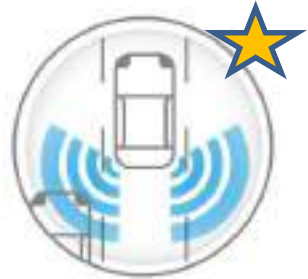
BLIND SPOT WARNING