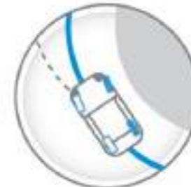
INTELLIGENT TRACE CONTROL