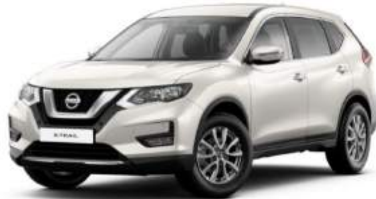
Blanco perlado QAB