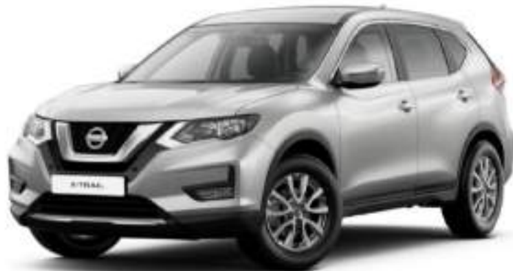
Gris Plata K23