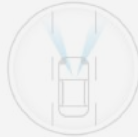
LANE DEPARTURE WARNING