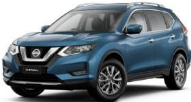
Azul metálico RAW