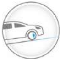
HILL START ASSIST