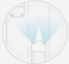
HIGH BEAM ASSIST