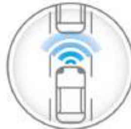
INTELLIGENT BRAKE ASSIST