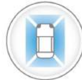
INTELLIGENT AROUND VIEW MONITOR

Monitor inteligente de visión periférica 360°