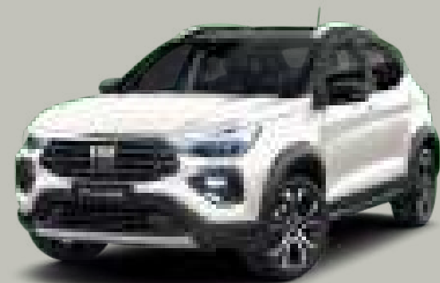
53 - BLANCO ALASKA