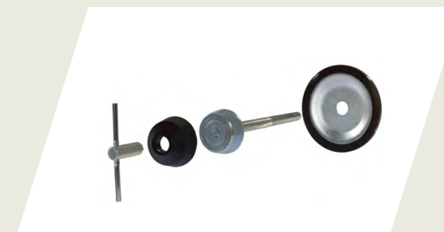
BULÓN DE SEGURIDAD PARA RUEDA DE AUXILIO CÓD. 50928093