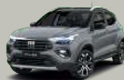
766 - GRIS STRATO