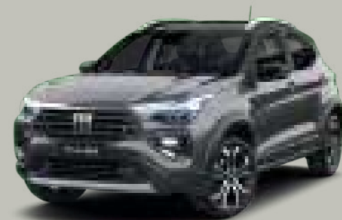
175 - GRIS SILVERSTONE