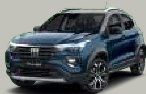
415 - AZUL AMALFI