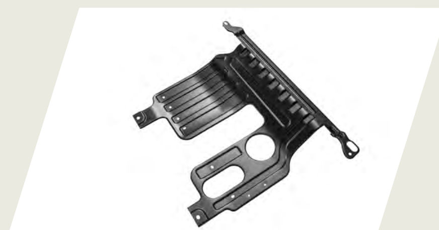
CUBRECARTER CÓD. 50290245