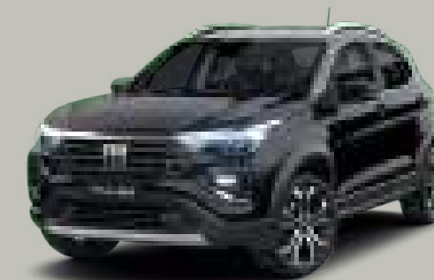
803 - NEGRO VULCANO