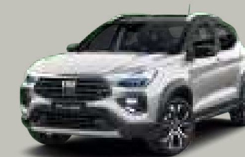
832 - PLATA BARI