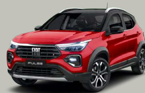
663 - ROJO MONTECARLO