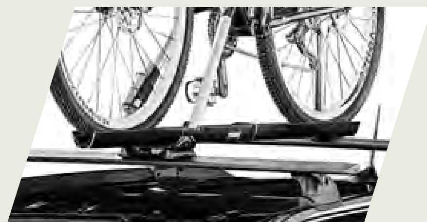
SOPORTE DE BICICLETA PARA TECHO CÓD. 50928310