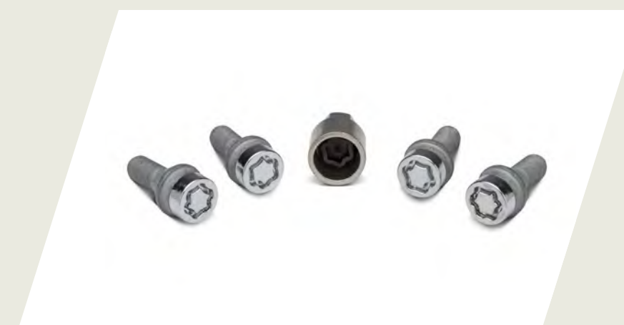
JUEGO DE TORNILLOS ANTIROBOS PARA RUEDA CÓD. 50902050