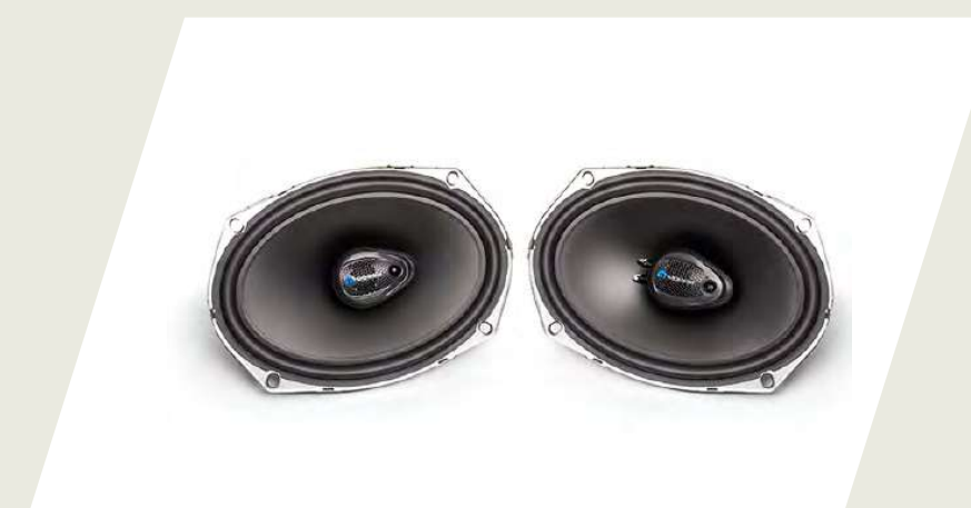
KIT PARLANTES DELANTEROS CÓD. 50928230