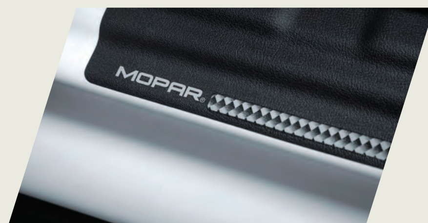
PROTECTOR VANO PUERTA VINILICO MOPAR CÓD. 50928105

Acercate a un concesionario y conocé la gama de accesorios originales que mopar te ofrece para equipar tu fiat pulse", seguido de las imágenes de cada accesorio.