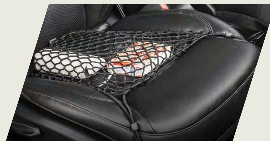
RED ELÁSTICA DE ASIENTO DELANTERO CÓD. 50927606