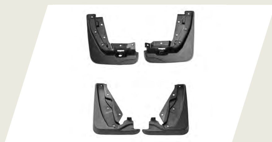
JUEGO DE BARREROS DELANTEROS Y TRASEROS CÓD. 50290576