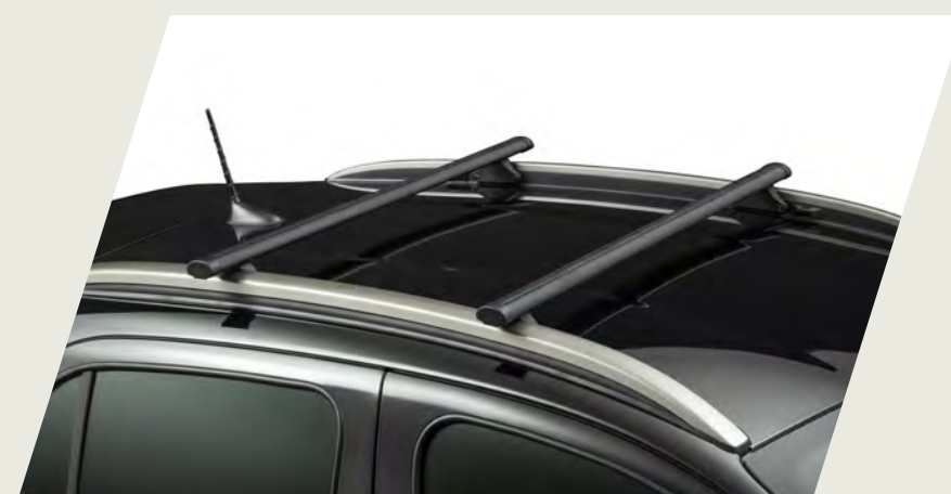
BARRA TRANSVERSAL DE TECHO CÓD. 50040107