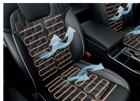
Asientos Calefaccionados y Ventilados