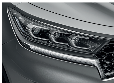
Faros Full LED