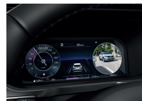
Monitor de Punto Ciego