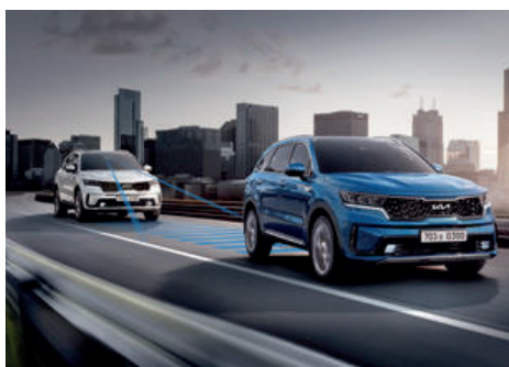
Drivewise - Ayudas a la conducción