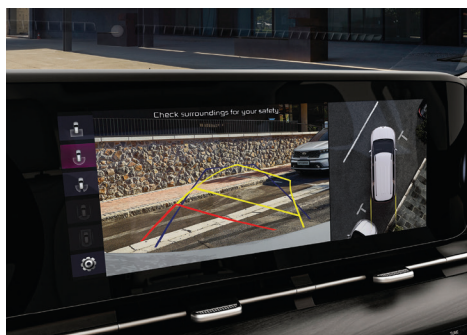
Cámara de 360°