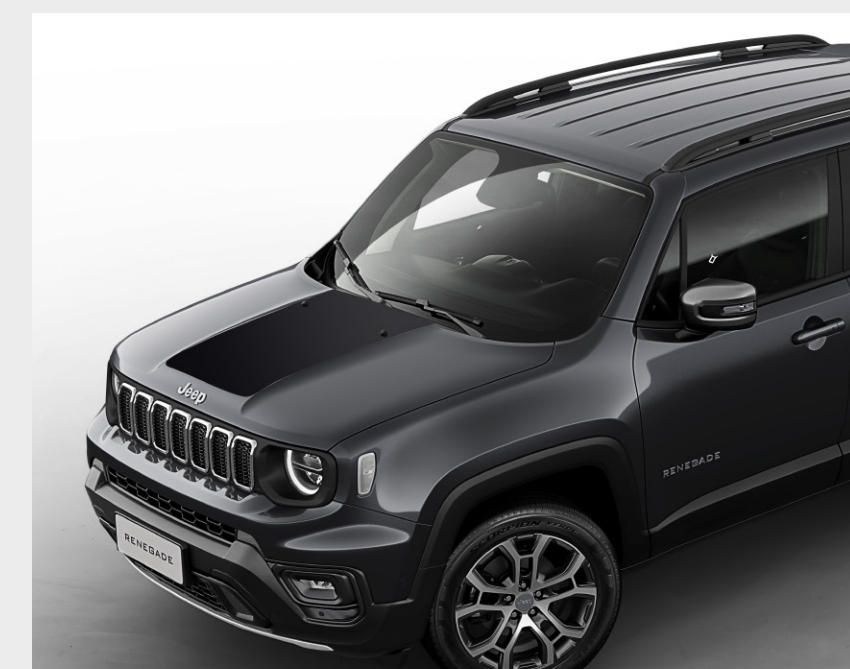
Adhesivo antireflejo Longitude