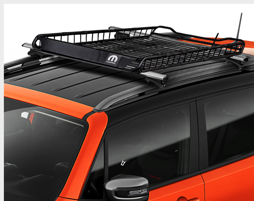
Parrilla portaequipaje MOPAR