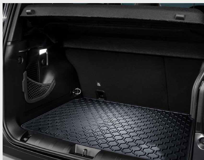
Alfombra baúl Longitude