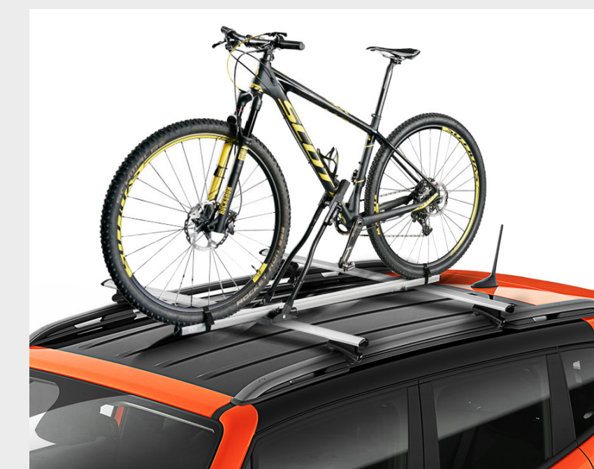
Soporte de bicicleta para techo