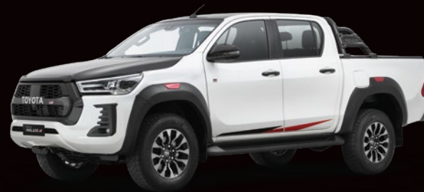
Blanco Perlado Bitono Negro*4