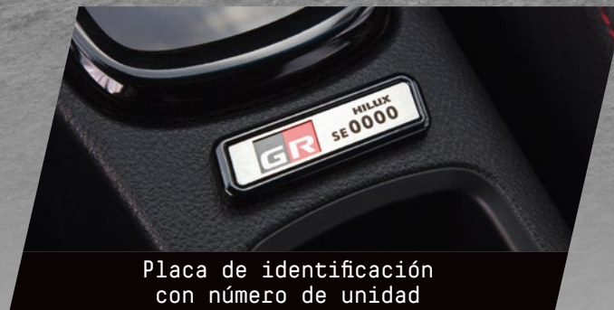
Placa de identificación con número de unidad