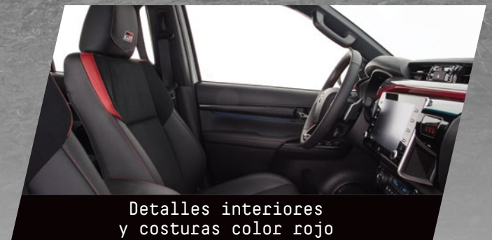
Detalles interiores y costuras color rojo