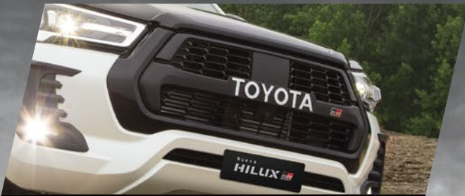
Parrilla exclusiva con emblema "TOYOTA"