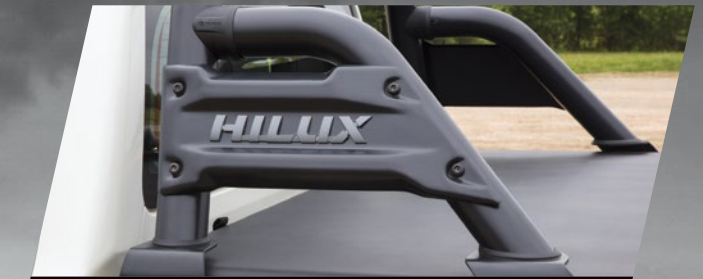
Barra exclusiva color negro