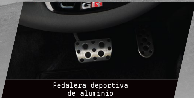
Pedalera deportiva de aluminio