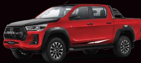
Rojo Metalizado Bitono Negro*4