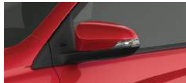
Espejos retráctiles eléctricamente. (1)