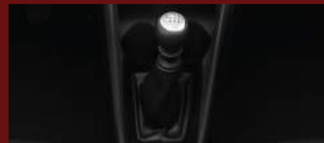
Caja manual de 6 marchas. (4)

Imágenes ilustrativas, no contractuales. (1) Disponible en versiones XLS, XLS Pack y S. (2) Disponible en versión S. (3) Disponible en versiones XLS Pack y S. (4) Disponible en versiones XS y XLS. *Solo para smartphones compatibles, con conexión USB. Verificá la compatibilidad de tu modelo de smartphone con su respectivo fabricante.