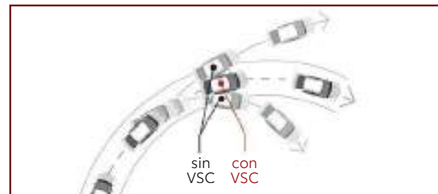
Control de estabilidad (VSC), control de tracción (TRC) y asistente de arranque en pendientes (HAC).