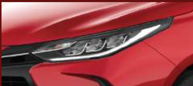
Ópticas delanteras LED con regulación en altura. (2)