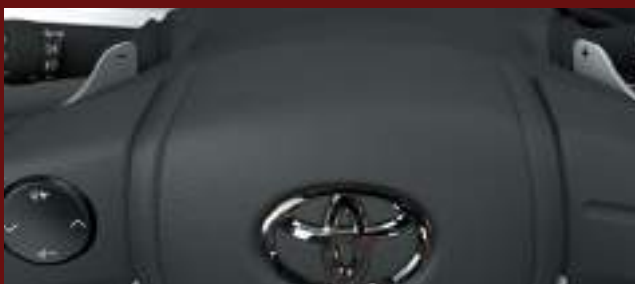
Paddle Shifts (levas en el volante). (3)