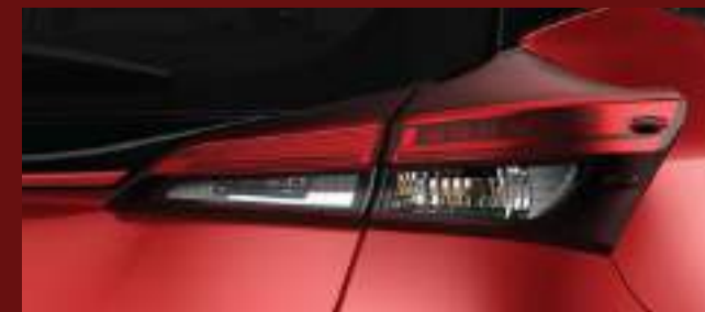
Ópticas traseras LED. (1)