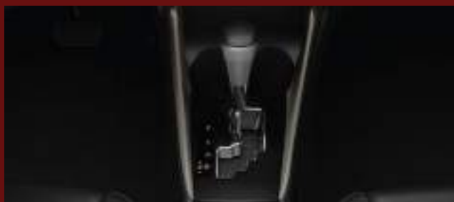
Caja automática CVT de 7 velocidades. (1)