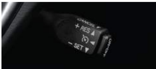
Control de velocidad crucero. (3)