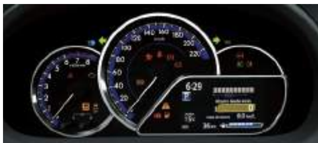
Display de información múltiple de 4,2". (4)