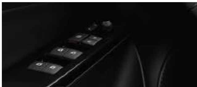
Levanta cristales eléctricos con función "One Touch" en las cuatro puertas. (1)