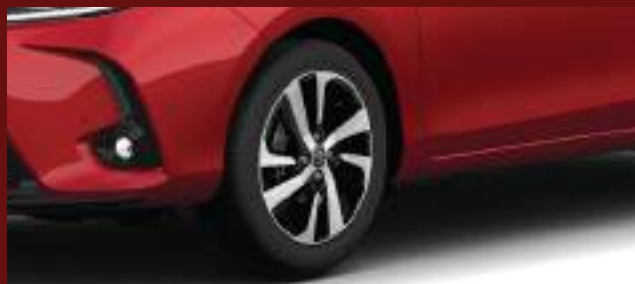
Llantas de aleación de 16". (3)