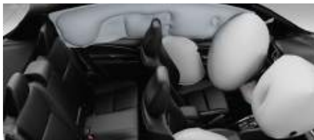
Airbags frontales (conductor y acompañante), laterales (x2), de cortina (x2) y de rodilla (para conductor).