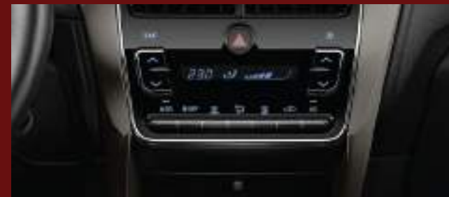
Aire acondicionado con climatizador automático digital. (1)