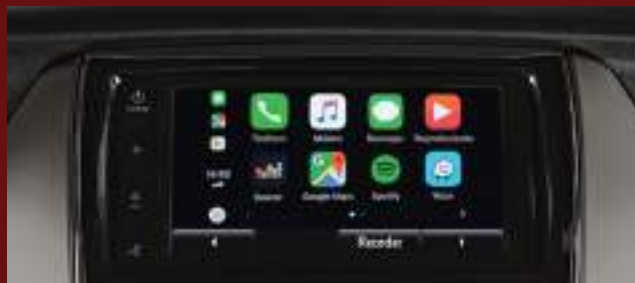
Audio con pantalla táctil LCD de 7" con conectividad*: Apple CarPlay® & Android Auto®.