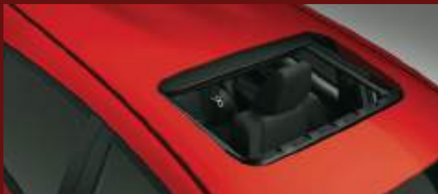
Techo solar eléctrico. (2)