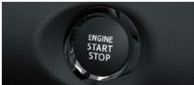
Sistema de encendido por botón (Push Start Button) y Sistema de ingreso inteligente (Smart Entry System). (2)