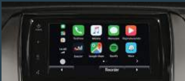
Audio con pantalla táctil LCD de 7" con conectividad*: Apple CarPlay® & Android Auto®.