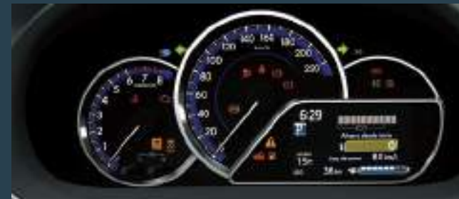
Display de información múltiple de 4,2". (3)