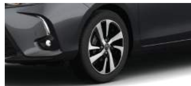
Llantas de aleación de 16". (1)