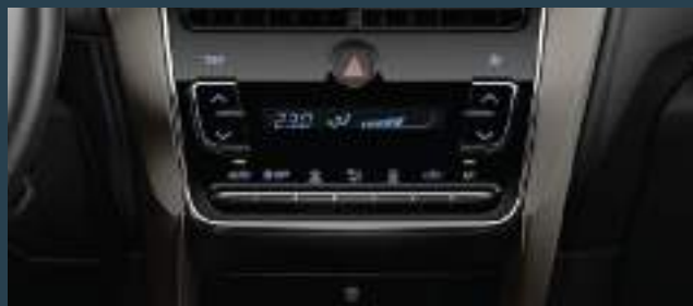
Aire acondicionado con climatizador automático digital.