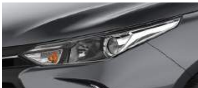
Ópticas delanteras halógenas con regulación en altura y proyector.