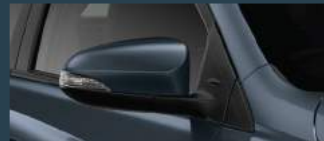
Espejos retráctiles eléctricamente.