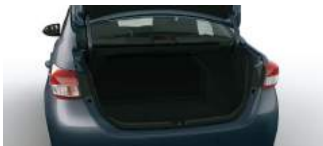
Apertura de baúl con comando a distancia.