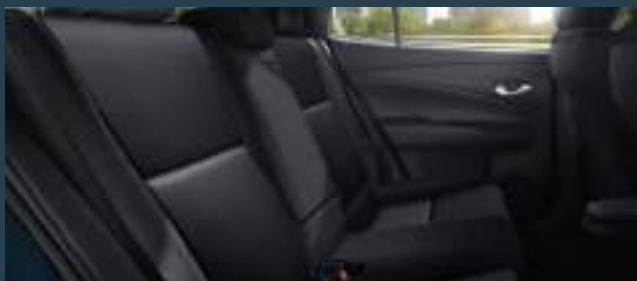
Asientos con tapizado de cuero natural y ecológico. (3)