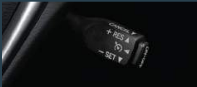
Control de velocidad crucero. (2)