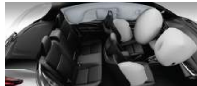
Airbags frontales (conductor y acompañante), laterales (x2), de cortina (x2) y de rodilla (para conductor).