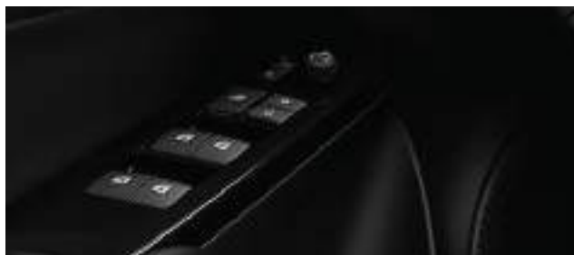
Levanta cristales eléctricos con función "One Touch" en las cuatro puertas.