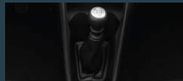
Caja manual de 6 marchas. (1)

Imágenes ilustrativas, no contractuales. (1) Disponible en versión XLS. (2) Disponible en versiones XLS y XLS Pack. (3) Disponible en versión XLS Pack.