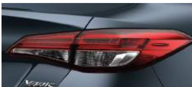
Ópticas traseras LED.