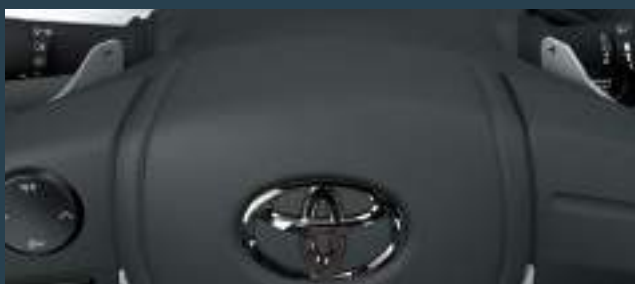
Paddle Shifts (levas en el volante). (3)