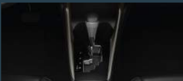
Caja automática CVT de 7 velocidades. (2)